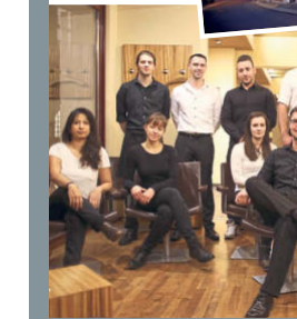
Das „Lujah“ in der Kleinen Ull