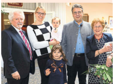
Gruppenbild mit Freunden: Die Gabriels sind mit Magdeburgs Ex-OB und dessen Ehefrau schon lange per Du

Magdeburg - Wenn Willi Polte (80, SPD) Party macht, geht es auch im engsten Freundes- und Familienkreis nicht ganz ohne Promis ab. Bei der privaten Doppel-Nachfeier zum 160. (Poltes Ehefrau Isa wurde auch gerade 80) standen am Samstag u. a. Bundesaußenminister Sigmar Gabriel (58, SPD) und Ehefrau Anke (41), samt Töchtern in der Reihe der Gratulanten. Der Bundesaußenminister Sigmar Gabriel (58, SPD) beim Festschmaus mit Isa und Willi Polte (beide 80) Besuch im Hotel „Ratswaage“, wo etwa 100 Gäste die Poltes feierten, überraschte den Ex-OB und Ehrenbürger der Landeshauptstadt gar nicht: „Sig-