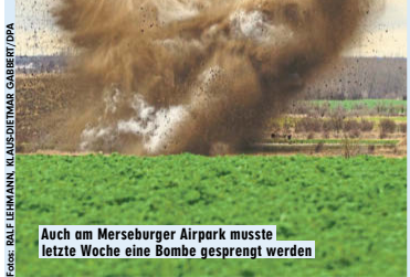
Auch am Merseburger Airpark musste letzte Woche eine Bombe gesprengt werden