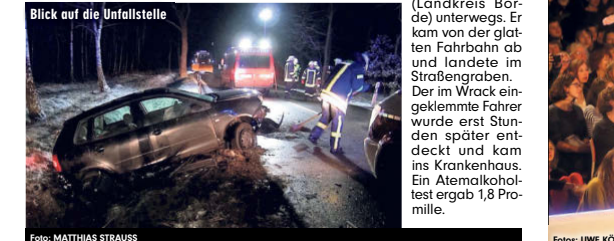
Blick auf die Unfallstelle

Calvörde - Eisglätte, Alkohol und dann auch noch Autofahren - eine ganz gefährliche Mischung. Sufi-Unfall auf der L 25. Sonntagmorgen war ein Autofahrer zwischen Flechtlingen und Calvörde (Landkreis Börde) unterwegs. Er kam von der glatten Fahrbahn ab und landete im Straßengraben. Der im Wreck eingeklemmte Fahrer wurde erst Stunden später entdeckt und kam ins Krankenhaus. Ein Atemalkoholtest ergab 1,8 Promille.