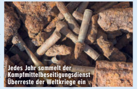
Jedes Jahr sammelt der Kampfmittelbeseitigungsdienst Überreste der Weltkriege ein

Jahr 21 Tonnen entdeckt. 2016 waren es 94 Tonnen, 2015 sogar noch 141 Tonnen. Doch das sei laut Kresse Zufall: „Die Zahl schwankt jährlich sehr stark. Das hängt davon ab, wie viele Baumaßnahmen und Bäumungen auf Truppenübungsplätzen es gibt.“