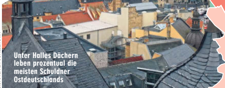
Unter Halles Dächern leben prozentual die meisten Schuldner Ostdeutschlands

Blankenburg - Schweine-Alarm Gestern musste die Polizei wegen acht Wildschweinen ausrücken, die in der Blankenburg (Harz) eine Straße belagerten. Ein Jagdpächter trieb die Rotte aus der Stadt.