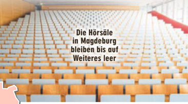
Die Hörsäle in Magdeburg bleiben bis auf Weiteres leer

Magdeburg - Wegen der lokalen und nationalen Corona-Lage ist an der Otto-von-Guericke-Universität Magdeburg ein Fünf-Stufen-Plan in Kraft getreten. Momentan gelte Stufe drei, erklärte gestern eine Sprecherin der Hochschule. Demnach finden bis auf Weiteres alle Vorlesungen nur online statt. Seminare, Übungen, Tutorien oder Praktika können unter den geltenden Hygienebestimmungen in Präsenz stattfinden, sofern es nötig sei.